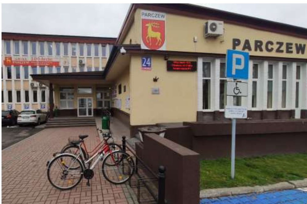
Budynek Urzędu Miasta widok od strony ulicy Warszawskiej

Do budynku prowadzą dwa wejścia. Wejście od ulicy Warszawskiej 24 oraz wejście od ulicy Kolejowej. Wejście od ulicy Warszawskiej jest dostępne dla osób niepełnosprawnych.