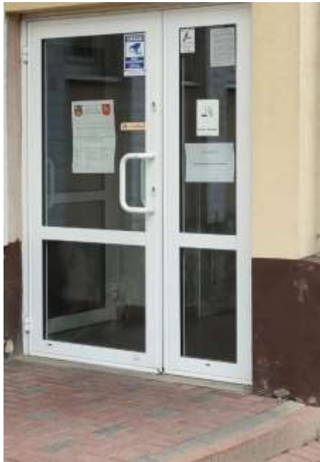
Budynek Urzędu Miejskiego widok od strony ulicy Kolejowej

Urząd Miejski w Parczewie to miejsce, w którym pracuje Burmistrz i urzędnicy.